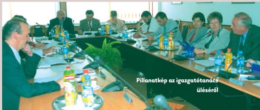
Pillanatkép az igazgatótanács üléséről

Az önkéntes haderő létrejötté pedig újabb nagy lehetőséget rejt, mert bejövő szerződéses katonáink körülbelül fele – felméréseink szerint – nem tagja semmilyen pénztárnak. Ha tehát megfelelő módon szólítjuk meg őket, kialakulhat egy újabb, természetes utánpótlási, növekedési bázis. Megjegyzem,