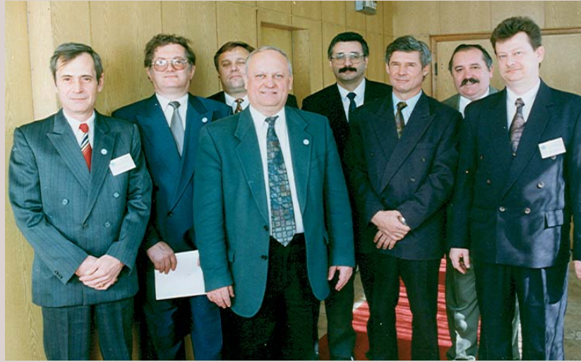
Az első igazgatótanács tagjai